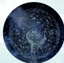
Daten sind jederzeit griffbereit