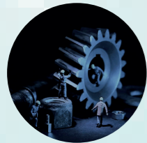
Integration der gesamten Anlage

Ein intuitives Bedienungskonzept verfolgt den Ansatz, dass sich der User schnell zurechtfindet und Informationen schnell und einfach findet. b-connected ist auf jedem webfähigen Endgerät verfügbar, egal ob PC, Tablet oder Smartphone. Der Anlagenbetreiber hat seine Anlage über Echtzeitdaten im Blick, erkennt Stillstandsursachen und kann gezielt Maßnahmen setzen, um die Anlagenverfügbarkeit zu erhöhen und gleichzeitig Stillstandszeiten zu reduzieren.