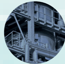
Zentrale Steuerung der Wartung

Zusätzlich stehen Mitarbeitenden relevante Dokumente, wie Maschinen- oder Anlagendokumentationen, Schulungsunterlagen und Fotos von Rundgängen, zentral zur Verfügung. Wartungsaktivitäten können geplant, koordiniert und protokolliert werden. Durch die gute Koordination der Services werden Betriebs- und Anlagenausfallkosten minimiert.