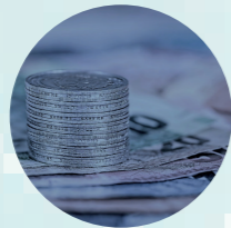
Minimierte Anlagen- ausfallskosten